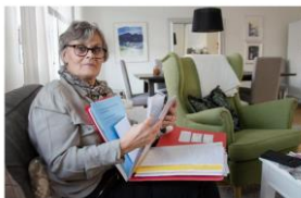
Elisabeths journal är minst lika smäckad. Hon har dessutom detekt dagvis under hela sin cancerresa.