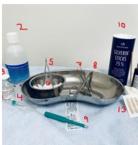
Utrustning som behövs