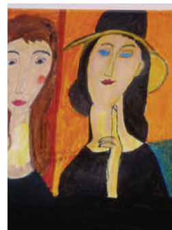
Thomas Neuendorffs tolkning av Modiglianis bild.

Utställningen hänger fram till och med vecka 11 2013 i Örnsköldsvik.