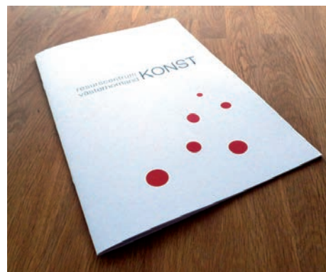
Resurscentrum konst är ett utvecklingsprojekt med stöd från Statens kulturråd fram till och med 2014.