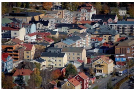
Vy över Örnköldsvik. Ett av tre bostadsområden där en ungdomssatsning ska ske.

CINERGY är ett EU-projekt inom programmet Norra Periferin. Det drivs med Landstinget som ansvarig partner tillsammans med sex andra partners från tre länder – Sverige, Finland och Nordirland.