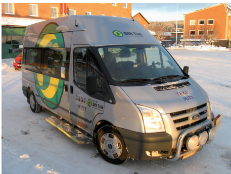
Specialfordon som trafikerar sjukreselinje 190.

Om du inte vill få våra nyhetsbrev i fortsättningen, meddela oss via e-post på regionalutveckling@lvn.se