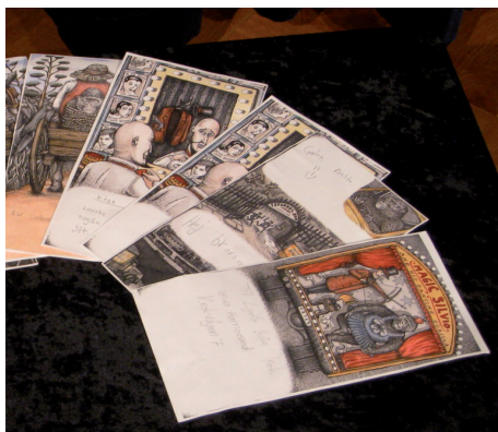
Litteraturarbete utifrån Legenden om Sally Jones av Jacob Wergelius.