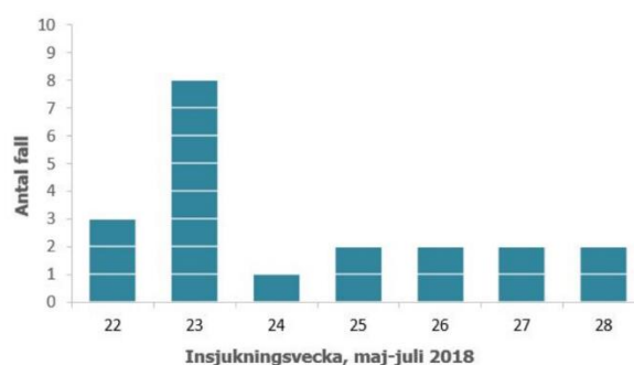
Antal fall i hepatit A utbrottet, 30 maj-10 juli 2018 (n=20, 180912)