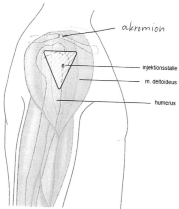
Intramuskulär injektion i överarmen.